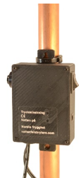
Elektronikbox monteras med buntband på rör eller med skruv på vägg. Mått: 60x25x80 mm.