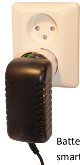
Batterielementet sätts i en smart plug (medföljer ej).